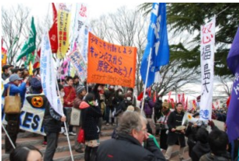
3・11 郡山デモに全学連も福島大先頭に全国から総決起

私は3・11一周年を迎え、原発事故を風化させず、国・東電・電力会社の悪事を暴き、大衆による「カチコミ」で私たち人民の力を示す事が、3・11を真に反省するための一歩と考えます。国民の傷の舐め合いや痛み分けに組みするだけではなく、人災の張本人をハッキリさせ、責任追及を行う、その時が2年目の今です。共に怒り、立ち上がりましょう!(法大一年生)