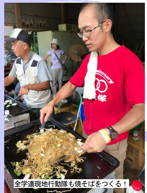
全学連現地行動隊も焼そばをつくる！