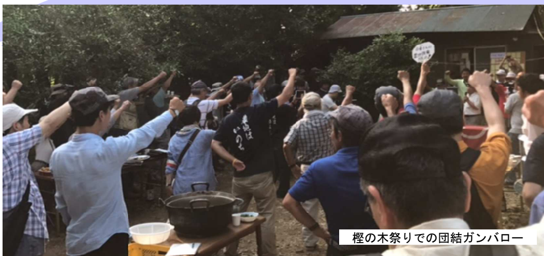
檜の木祭りでの団結ガンパロー